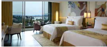
ルネッサンス三亜リゾート&スパ 1泊に必要なクラブポイント数: 5,000 - スタンダードルーム