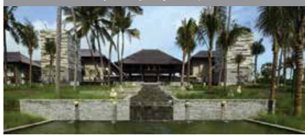
コートヤード・バイ・マリオット・バリ・ヌサドゥア 1泊に必要なクラブポイント数: 3,500 - デラックス・プールビュールーム