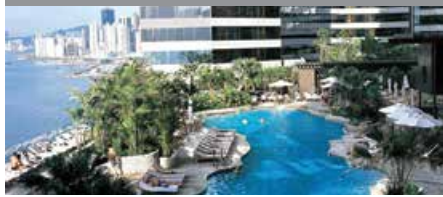
ルネッサンス・ハーバービュー・ホテル香港 1泊に必要なクラブポイント数: 6,500 - スタンダードルーム