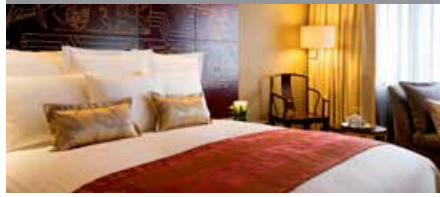
チャイナ・ホテル・マリオット・ホテル広州 1泊に必要なクラブポイント数: 4,000 - スタンダードルーム