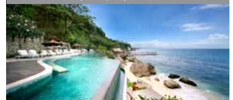
アヤナリゾート&スパ(バリ) 1泊に必要なクラブポイント数: 7,500 - スタンダードルーム 6,500 - リンパ・ジンバラ・バリ・バイ・ アヤナのジンバラ・ペイルーム §