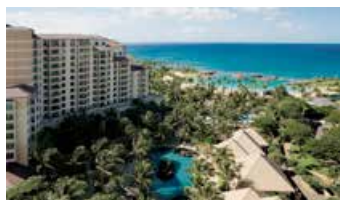
Marriott's Ko Olina Beach Club, 美國夏威夷