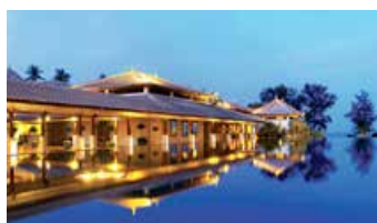
Marriott's Phuket Beach Club, 泰國布吉島