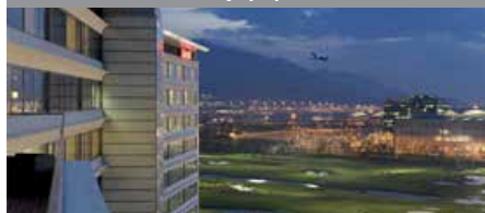
Hong Kong SkyCity Marriott Hotel