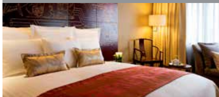
China Hotel, A Marriott Hotel, Guangzhou