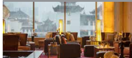
Renaissance Shanghai Yu Garden Hotel