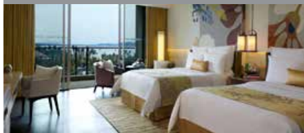
Renaissance Sanya Resort & Spa