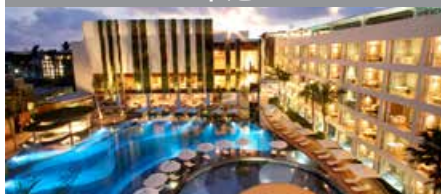
The Stones Hotel - Legian Bali