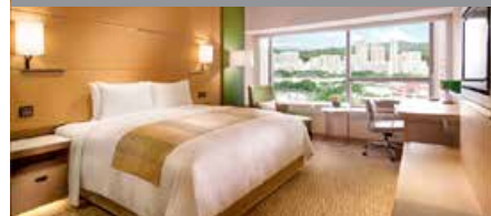
Courtyard by Marriott Hong Kong Sha Tin