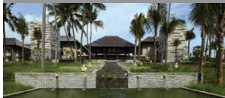
Courtyard by Marriott Bali Nusa Dua