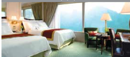
JW Marriott Hotel Hong Kong