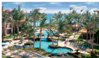
Marriott's Waiohai Beach Club, 美國夏威夷