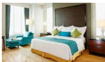
Marriott Vacation Club at The Empire Place®, 泰國曼谷