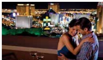
Marriott's Grand Chateau, 美國拉斯維加斯