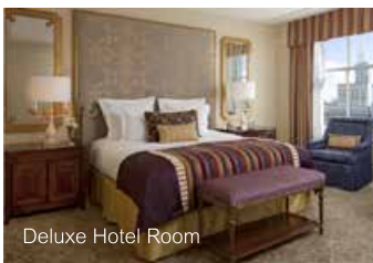
Deluxe Hotel Room