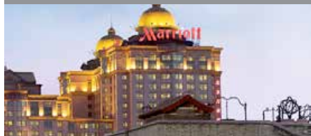
Beijing Marriott Hotel City Wall