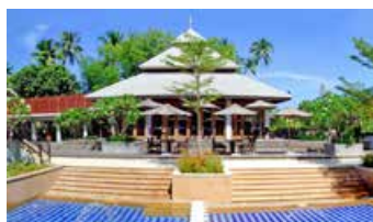
Marriott's Mai Khao Beach - Phuket, 泰國布吉島