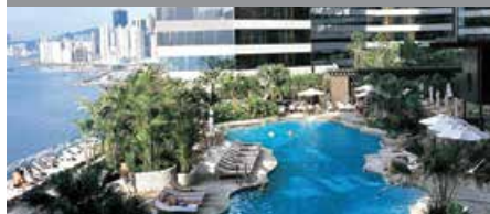
Renaissance Harbour View Hotel Hong Kong