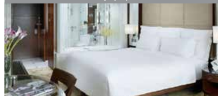
Langham Place, Mongkok, Hong Kong