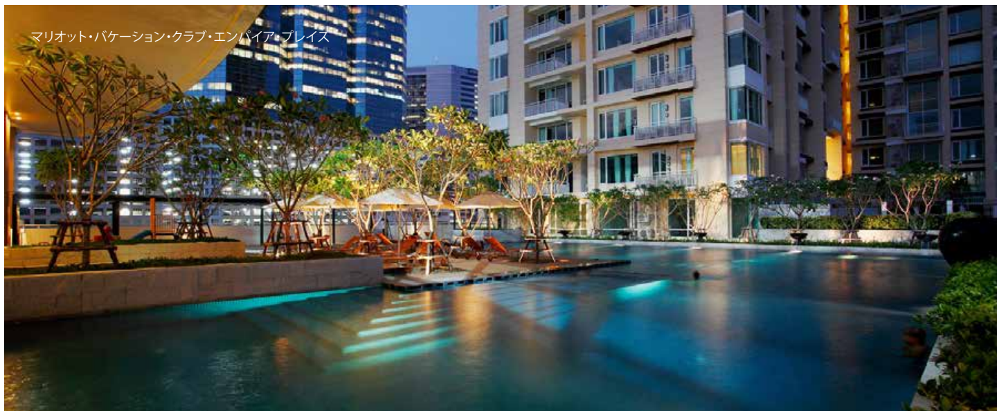
マリオット・バケーション・クラブ・エンパイア・プレイス

ご予約期間とご予約キャンセル規定は、第三改訂版 開示説明書およびクラブに関するガイドライン(今後、変更されることがございます)に基づきます。クラブ・コネクション・プログラムやメンバーズスペシャルの各ホテルとリゾートの利用可能なお部屋数には限りがございます。お部屋は空室状況により、また適用除外日があります。本施設では、エクスプレス・ブレイクをご利用いただけません。本施設と必要クラブポイント数は、定期的および予告なく変更となる場合があります。これらのホテルやリゾートは、マリオット・バケーション・クラブ、アジア・パシフィックの施設およびクラブリゾート施設ではありません。クラブ・コネクション施設の空室状況は、クラブ管理者が施設運営者との間に締結した合意条件により変更される可能性があります。