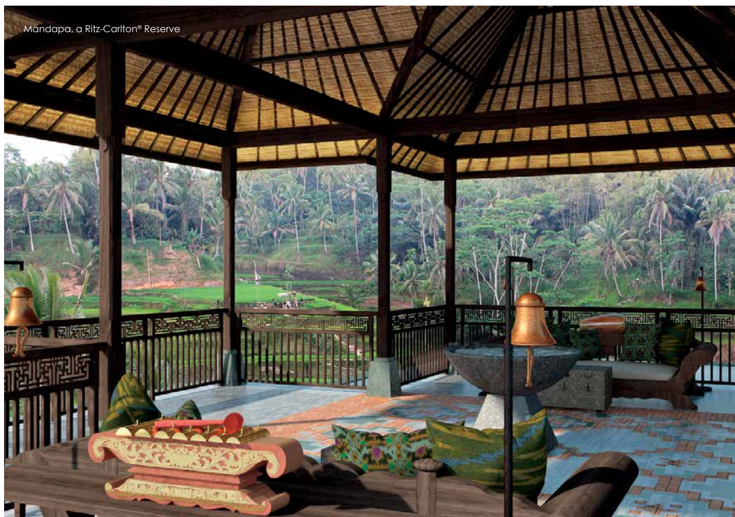
Mandapa, a Ritz-Carlton® Reserve