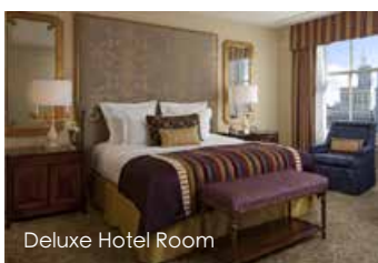
Deluxe Hotel Room