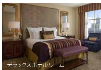
デラックスホテルルーム