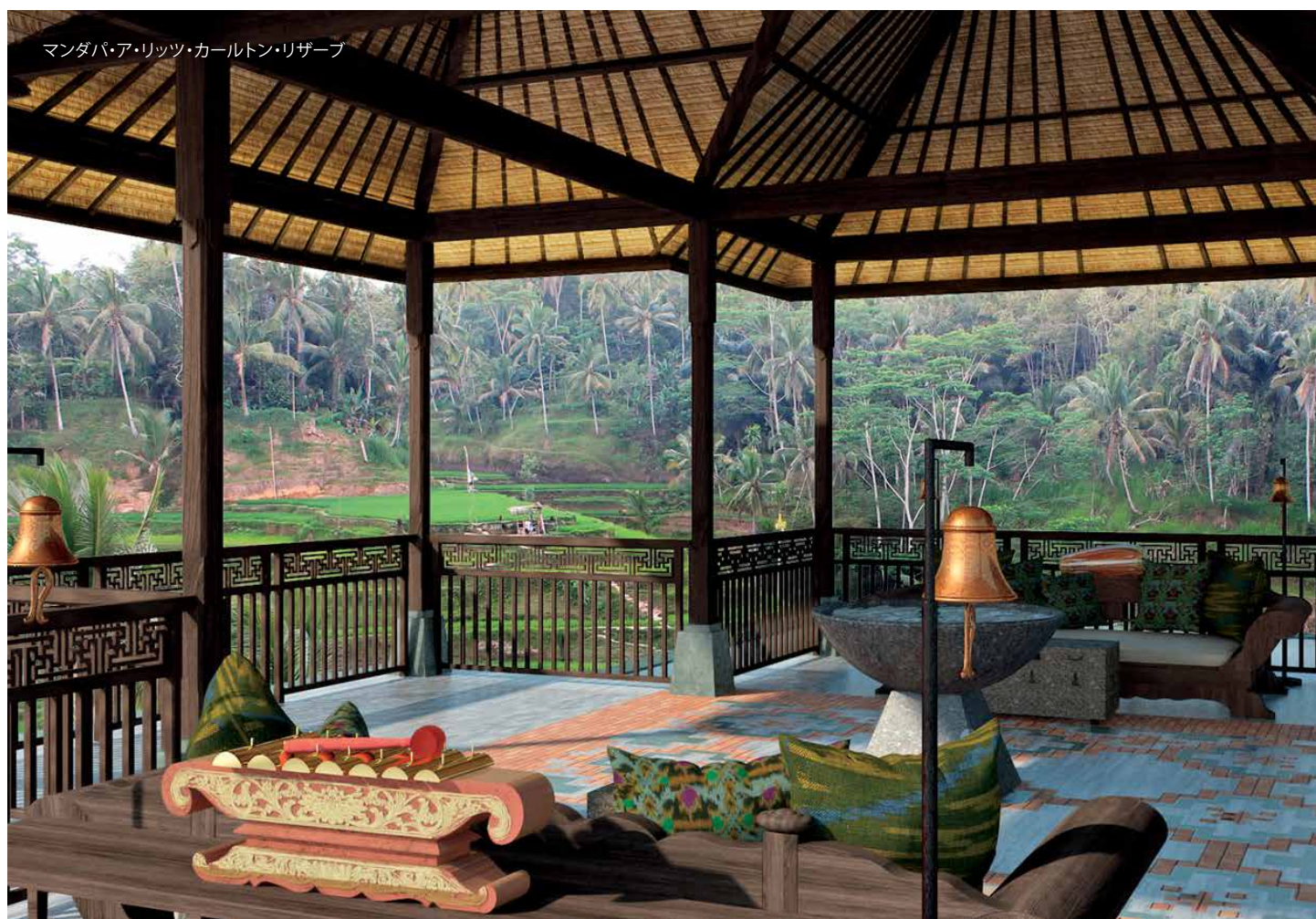
マンダパ・ア・リッツ・カールトン・リザーブ