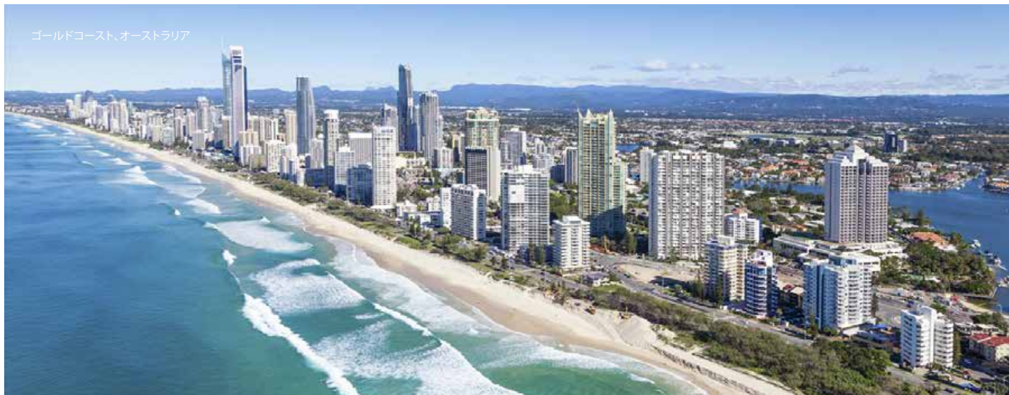
ゴールドコースト、オーストラリア

予約期間とキャンセル規定は、第三改訂版 開示説明書およびクラブに関するガイドライン(今後、変更されることがございます)に基づきます。クラブ・コネクション・プログラムで提供される各ホテルとリゾートの利用可能な部屋数には限りがあります。お部屋は空室状況により、また適用除外日があります。エクスプレス・ブレイクは、これらの施設ではご利用いただけません。これらの施設と必要クラブポイント数は、定期的および予告なく変更となる場合があります。これらのホテルやリゾートは、マリオット・バケーション・クラブ、アジア・パシフィックの施設およびクラブリゾートではありません。クラブ・コネクション施設の空室状況は、クラブ管理者が施設運営者との間に締結した合意条件により変更される可能性があります。