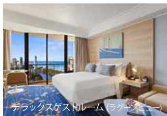
デラックスゲストルーム(ラグーン側)