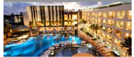
ザ・ストーン・ホテルレギャンバリ 1泊に必要なクラブポイント数: 4,500 - スタンダードルーム