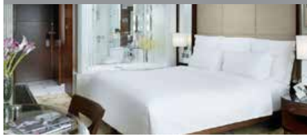
ランガム・プレイス・モンコック・香港 1泊に必要なクラブポイント数: 5,500 - エッセンシャル・プレイス