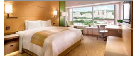
コートヤード・バイ・マリオット沙田・香港 1泊に必要なクラブポイント数: 3,500 - スタンダードルーム