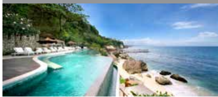
アヤナリゾート&スパ(バリ) 1泊に必要なクラブポイント数: 7,500 - スタンダードルーム 6,500 - リンバ・ジンバラン・バリ・バイ・ アヤナのジンバラン・ベイルーム