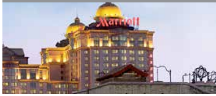
北京マリオットホテル・シティ・ウォール 1泊に必要なクラブポイント数: 4,500 - スタンダードルーム