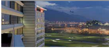
香港・スカイシティ・マリオットホテル 1泊に必要なクラブポイント数: 4,500 - スタンダードルーム