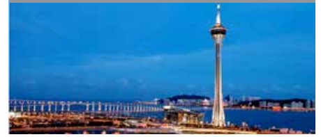
JWマリオット・ホテル・マカオ* 1泊に必要なクラブポイント数: 6,500 - スタンダードルーム (日曜日 - 木曜日) 7,500 - スタンダードルーム (金曜日 & 土曜日)