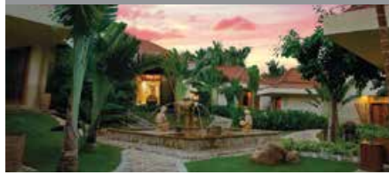
三亜マリオット・ヤーロンベイ・リゾート&スパ 1泊に必要なクラブポイント数: 7,000 - スタンダードルーム