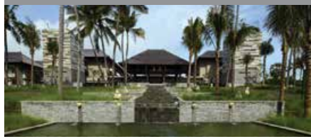
コートヤード・バイ・マリオット・バリ・ヌサドゥア 1泊に必要なクラブポイント数: 3,500 - デラックス・プールビュールーム