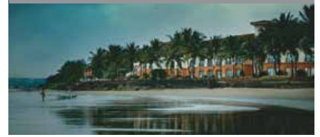
ゴア・マリオット・リゾート&スパ 1泊に必要なクラブポイント数: 6,000 - スタンダードルーム