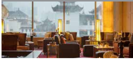
ルネッサンス上海豫園ホテル 1泊に必要なクラブポイント数: 5,000 - スタンダードルーム