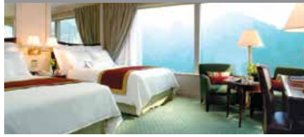
JWマリオットホテル香港 1泊に必要なクラブポイント数: 8,000 - スタンダードルーム