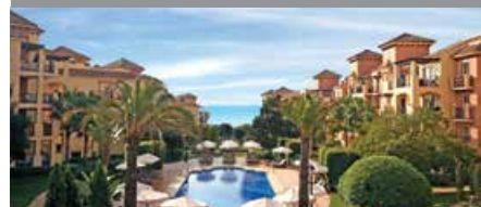
マリオット・マルベラ・ビーチ・リゾート↑ 1泊に必要なクラブポイント数: 2,750 - 10,000 - 2ベッドルームヴィラ 3,000 - 11,000 - 3ベッドルームヴィラ