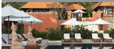
ルネッサンス・コ・サムイ・リゾート & スパ 1泊に必要なクラブポイント数: 4,000 - スタンダードルーム