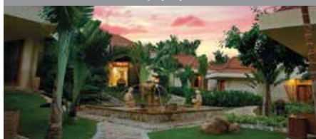
三亜マリオット・ヤロンベイ・リゾート&スパ 1泊に必要なクラブポイント数: 7,000 - スタンダードルーム