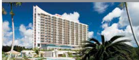
オキナワ マリオットリゾート & スパ 1泊に必要なクラブポイント数: 6,500 - スタンダードルーム