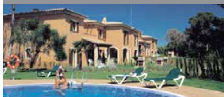
マリオット・クラブ・ソン・アンテム↑ 1泊に必要なクラブポイント数: 2,500 - 8,750 - 2ベッドルームヴィラ