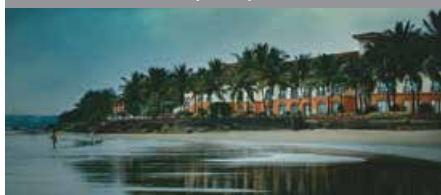
ゴア・マリオット・リゾート&スパ 1泊に必要なクラブポイント数: 6,000 - スタンダードルーム