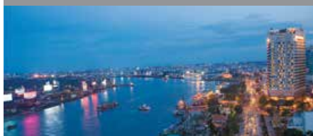
ルネッサンス・リバーサイド・ホテル・サイゴン 1泊に必要なクラブポイント数: 4,500 - スタンダードルーム