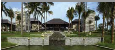
コートヤード・バイ・マリオット・バリ・ヌサドゥア 1泊に必要なクラブポイント数: 3,500 - デラックス・プールビュールーム