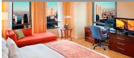
ニューヨーク・マリオット・アット・ザ・ ブルックリン・ブリッジ* 1泊に必要なクラブポイント数: 10,000 - 14,750 - スタンダード(キングベッド)ルーム 12,250 - 15,500 - スタンダード(ダブルベッド)ルーム