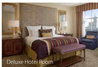
Deluxe Hotel Room