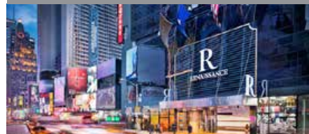
ルネッサンス・ニューヨーク・タイムズスクウェア・ ホテル* 1泊に必要なクラブポイント数: 12,000 - 17,750 - スタンダード(キングベッド)ルーム 14,250 - 18,500 - スタンダード(ダブルベッド)ルーム