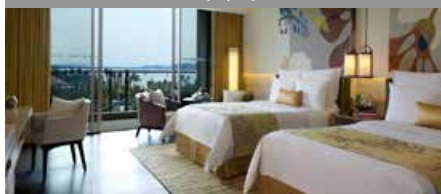
ルネッサンス三亜リゾート&スパ 1泊に必要なクラブポイント数: 5,000 - スタンダードルーム