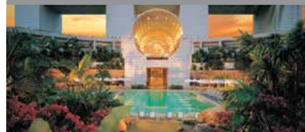
ザ・リッツ・カールトン・ミレーニア・シンガポール 1泊に必要なクラブポイント数: 6,500 - スタンダードルーム 注意事項: 金曜日、土曜日 & 日曜日宿泊分のみのご予約に限りです。