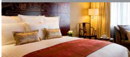
チャイナ・ホテル・マリオット・ホテル広州 1泊に必要なクラブポイント数: 4,000 - スタンダードルーム