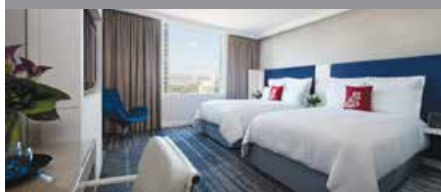
シドニー・ハーバー・マリオット・ホテル・ アット・サーキュラーキー 1泊に必要なクラブポイント数: 7,000 - スタンダードルーム