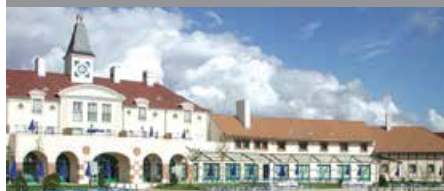
マリオット・ヴィレッジ・イル・ド・フランス↑ 1泊に必要なクラブポイント数: 1,750 - 10,750 - 2ベッドルームヴィラ 2,250 - 12,000 - 3ベッドルームヴィラ