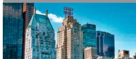
JWマリオット・エッセックス・ハウス・ ニューヨークホテル 1泊に必要なクラブポイント数: 11,000 - 19,000 - スタンダードルーム 14,000 - 22,250 - ジュニア スイート