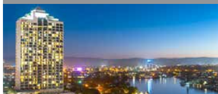
サーファーズ・パラダイス・マリオット・ リゾート & スパ 1泊に必要なクラブポイント数: 4,000 - スタンダードルーム