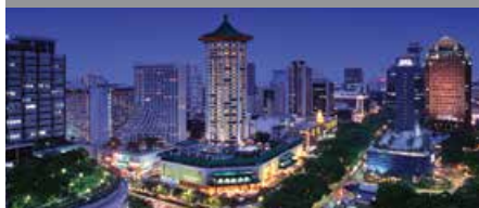
シンガポール・マリオット・タンク・プラザ・ ホテル 1泊に必要なクラブポイント数: 8,000 - スタンダードルーム