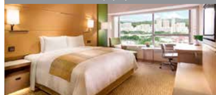
コートヤード・バイ・マリオット沙田・香港 1泊に必要なクラブポイント数: 3,500 - スタンダードルーム