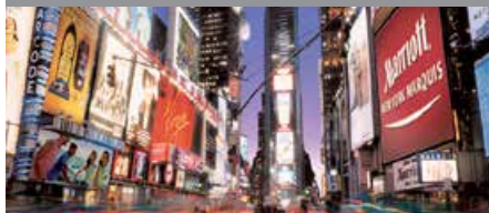
ニューヨーク・マリオット・マーキース* 1泊に必要なクラブポイント数: 12,000 - 17,750 - スタンダード(キングベッド)ルーム 14,250 - 18,500 - スタンダード(ダブルベッド)ルーム