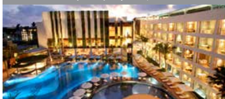
ザ・ストーン・ホテルレギャンバリ 1泊に必要なクラブポイント数: 4,500 - スタンダードルーム