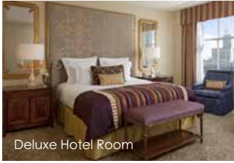
Deluxe Hotel Room